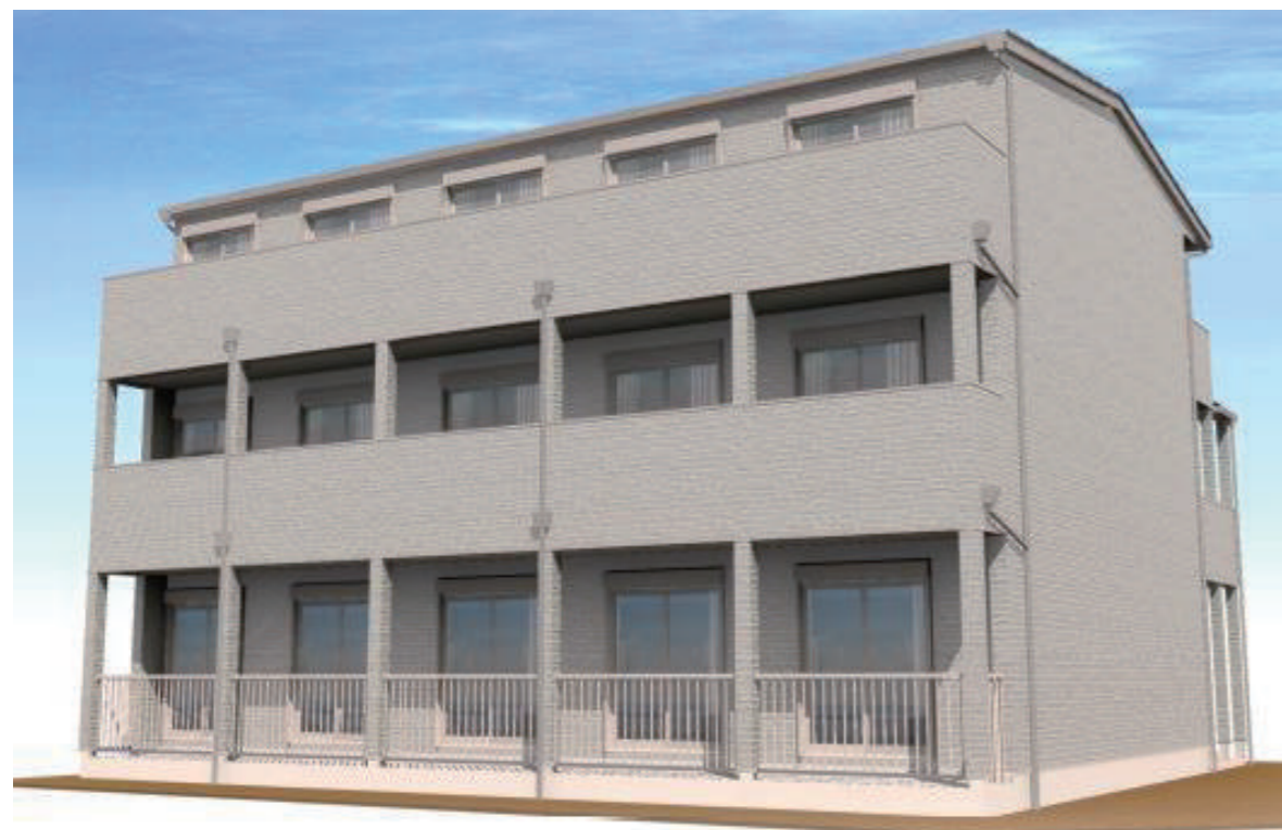
※完成予想図CGパースは、計画段階の図面を基に描いたもので実際とは異なります。 現況と異なる場合は現況を優先と致します。